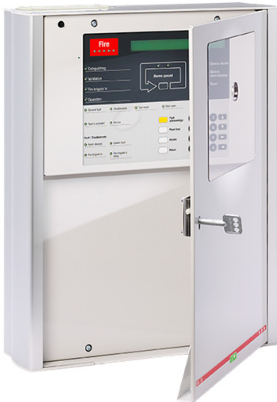
Figur 1: EBL128

Dokumentet beskriver hovedmenuerne (inkl. undermenuer) som er tilgængelige for adgangsniveau / type "Building officer" (Bygningsinspektør).